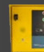
SÉRIE GST1 PLUS